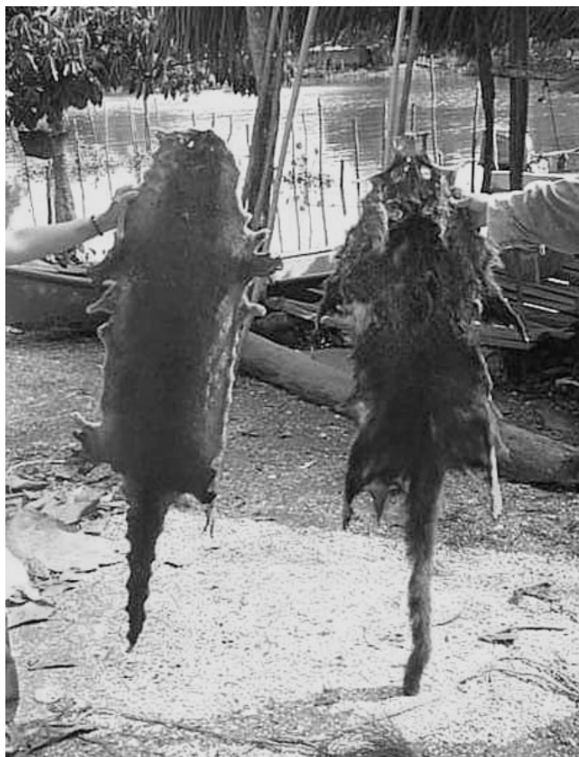
Figure 2. Skins of an otter ( Lontra longicaudis annectens ) and a tejón ( Nasua narica ) found in a fisherman's house at the Papaloapan river in November, 2002.

These observations and records, along with comments made by other Alvarado fishermen, suggest the species still occupies a vast extent of the SLA complex and wetlands, and emphasizes the need to conduct more detailed surveys and studies to determine the present status and ecology of the “perro de agua” (as it is locally known) and its habitat.